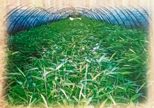
龙竹能耐-3~-4℃低温，在滇中以南及滇西海拔1700m以下地区可以发展。因为半年生龙竹袋苗

垂询电话：0871-5156184 传真：0871-5156542 移动电话：13888954426、13608712319 电子邮箱：ynbamboo@126.com 网址：http://www.ynbamboo.com