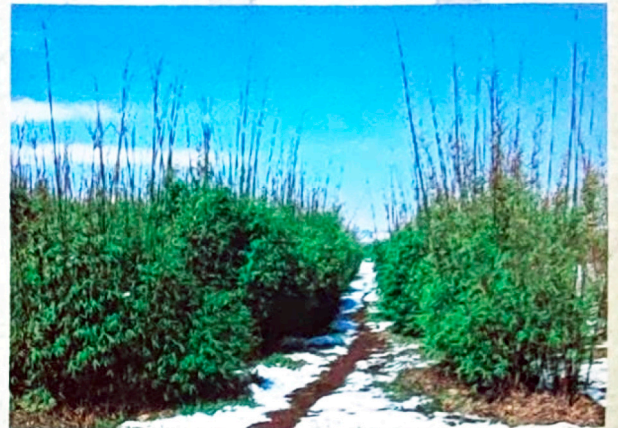
料慈竹，最优秀的制浆造纸原料，造林第3-4年进入丰产稳产期，每公顷年产鲜竹材30-45吨，每公顷年产值9000元以上。

我们注重与各有关教学、科研单位的合作，几年来，发表学术论文及科普文章30余篇，并收集有国内外竹产业发展的动态资料及竹子科教片1200分钟、图片3万余张。