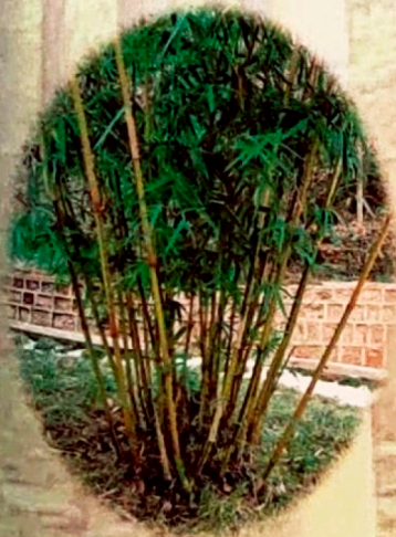
优秀的观赏用竹——琴丝竹，广泛用于城乡绿化美化。